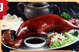
VỊT QUAY BẮC KINH