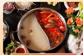
LÀU UYÊN ƯƠNG