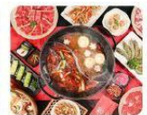
Lẩu viên ương